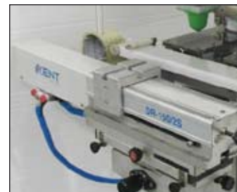
- Navette 2 couleurs (DR-150/2S)