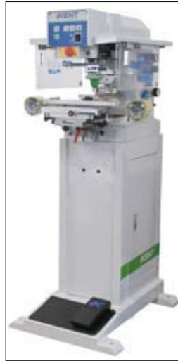
Nouveau meuble support MS-100 pour améliorer la stabilité