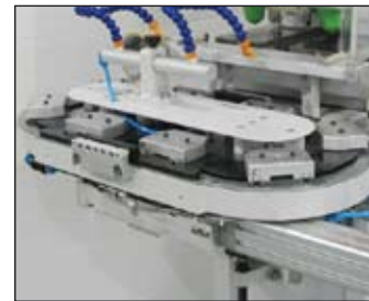
- Convoyeur 2 couleurs (C-150/8)