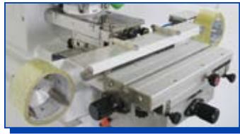
Auto-nettoyage tampon (encriers fermés seulement)